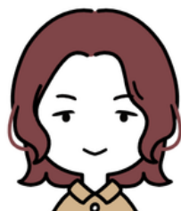
社会福祉士 小野 (おの)